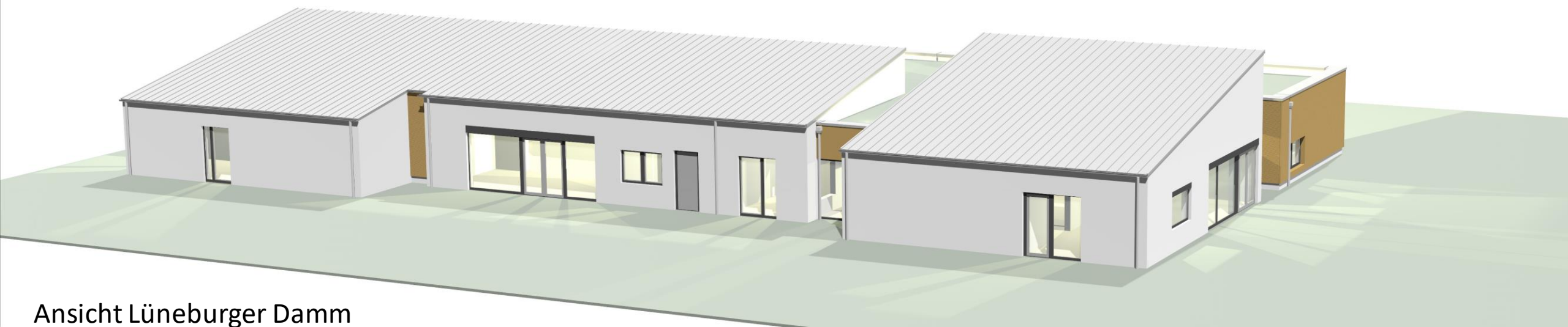
Ansicht Lüneburger Damm