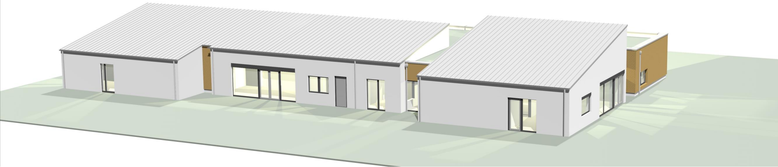
Neubau des Nikodemuskindergartens Zwischenbericht Gemeindeversammlung 12.03.2023