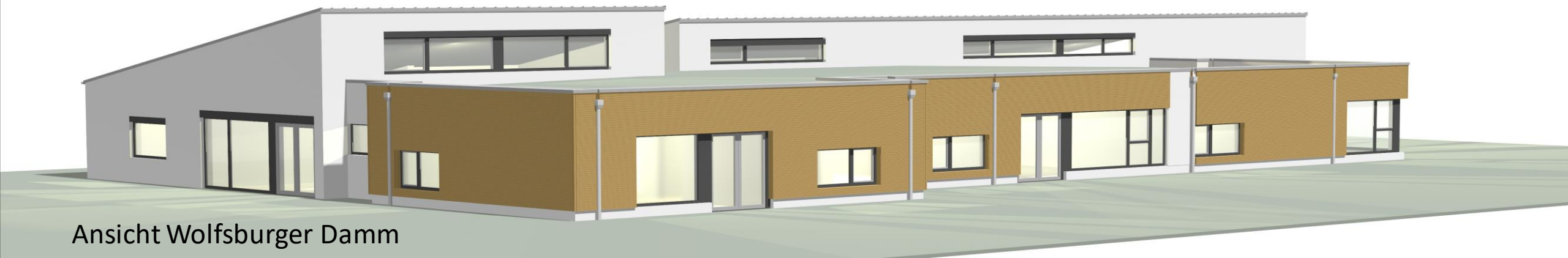
Ansicht Wolfsburger Damm, Ecke Lüneburger Damm (vom Spielplatz aus)